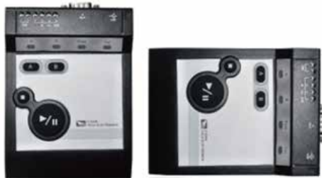
IT-254鍵盤(可配合電子負載完成自動化測試功能)