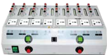
IT-E181測試系統治具 (可配合ITS9500完成充電器等電源模組的測試)