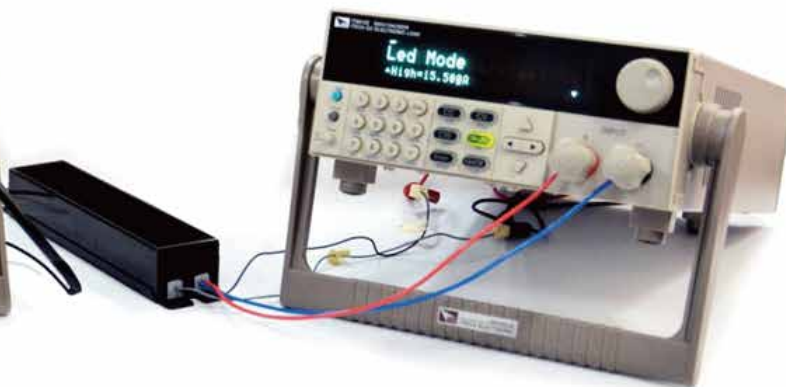
IT8912E 直流電子負載 (500V/15A/300W)