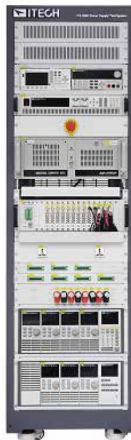
ITS9503-S0010 多路電源測試系統